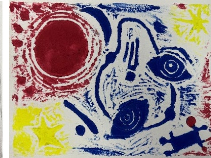
Algunes Il·lustracions del meu llibre d'artista